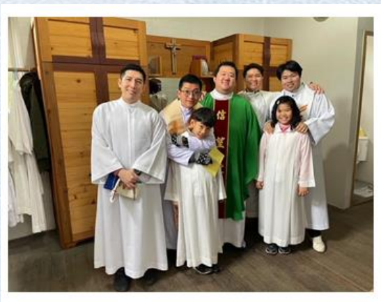
ของพวกเรา

ที่ไต่หวั่นนี้เอง นอกจากทำงานอภิบาลกับสัตบุรุษชาวไต่หวั่นที่วัด คุณพ่อยังได้อภิบาล กลุ่มคาทอลิกชาวไทยในไต่หวั่น ที่บางคนมาทำงาน มาเรียน หรือย้ายถิ่นฐานมาอยู่ที่นี่ ยังมีงานกับกลุ่มแรงงานชาวไทย ในการช่วยเหลือประสานงานด้านต่างๆ สอนภาษา นอกนั้นยังมีงานอื่นๆ เช่นงานอภิบาลกลุ่มนักศึกษา ผู้ต้องขัง และงานอื่นๆ ปัจจุบัน มีพระสงฆ์ชาวไทยทำงานที่ไต่หวั่น 3 ท่าน และสามเณรจากคณะธรรมทูตไทยอีก 1 คนที่กำลังศึกษาอยู่ที่นี้