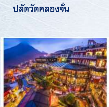
ปลัดวัดคลองจั่น