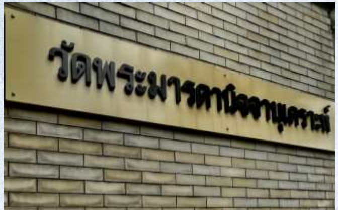
ปลัดวัดคลองจั่น

ที่มองบ้าง เราอาจพบสิ่งที่สวยงามที่ซ่อนอยู่ต่างไปจากเดิม บางทีที่เดิม ภาพเดิม ก็สวยงามกว่าเดิมอย่างคาดไม่ถึง แค่เปลี่ยนมุมมอง “