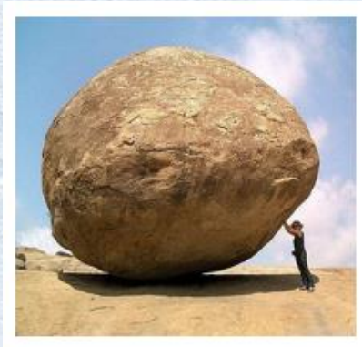
ปลัดวัดคลองจั่น

พ่อเชื่อว่าพี่น้องก็พบประสบการณ์ในรูปแบบที่แตกต่างออกไปในช่วงนั้น หรือแม้กระทั่งในประสบการณ์ชีวิตของเรา หลายครั้งที่มปัญหาพบอุปสรรค แต่ในปัญหา ในอุปสรรค หลายครั้งมันกลายเป็นบทเรียน สำหรับชีวิตของเรา ทำให้เราต้องพัฒนาตนเอง และหลายครั้ง ทำให้เราต้องปรับเปลี่ยนวิธีคิด วิธีการทำอะไรใหม่ๆ เสมอๆ ปัญหาอุปสรรค หลายครั้ง จึงเป็นข้อเรื่องประสบการณ์ใหม่ในชีวิตของเรา