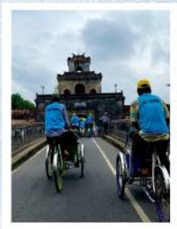
ปลัดวัดคลองจั่น

ทุกวันจึงเป็นการเดินทางชีวิตอย่างคุ้มค่า และมีความสุขกับมัน บางเรื่องที่ผ่านมา อาจกลับไปแก้ไขให้ดีกว่าเดิมไม่ได้ นอกจากเรียนรู้จากมันและเดินต่อไปข้างหน้าให้ดีกว่าเดิม