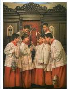
ปลัดวัดคลองจั่น

และในเดือนนี้ทางวัดเปิดรับสมัครพี่น้อง จะเป็นเด็กๆ เยาวชน หรือพี่น้องทุกเพศทุกวัย ที่ปรารถนาจะมีส่วนร่วมในมิสซากับวัดมากขึ้นด้วยการมาเป็นผู้อ่านบทอ่าน ในมิสซา พี่น้องลงชื่อสมัครได้ ไม่ต้องกังวล ไม่ต้องกลัวจะอ่านผิดอ่านถูก เพราะเราจะจัดให้มีการอบรม มีการแนะนำและฝึกเพื่อให้เกิดความคุ้นเคย ก่อน ถ้าพี่น้องสนใจ ลงชื่อเพื่อมีส่วนร่วมกับทางวัด และไม่ต้องกังวลว่า จะไม่สะดวก กลัวลงชื่อแล้วจะมาไม่ได้ ทางวัดก็จะจัดช่วงเวลาที่เหมาะสม สำหรับพี่น้อง ขอแค่สนใจ ขอแค่ปรารถนาจะมีส่วนร่วมกับพิธีกรรมกับวัด อย่างอื่นไม่ต้องกังวลครับ มาร่วมเป็นส่วนหนึ่งในมิสซาด้วยกันครับ